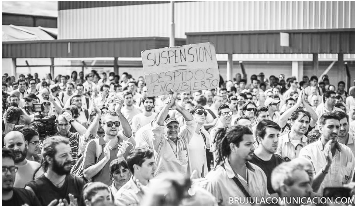
Movilización de los trabajadores de General Motors

de los compañeros de “adentro” de la planta, exigiendo que los delegados y la conducción del Smata reviertan