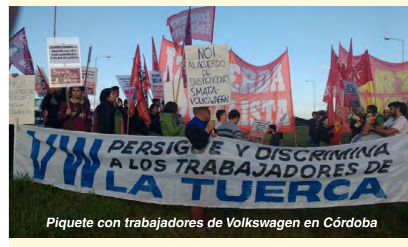
Piquete con trabajadores de Volkswagen en Córdoba

Los piquetes además sirvieron de cobertura a muchos trabajadores no sindicalizados o en negro que, queriendo adherir al paro, eran presionados por sus patronales para concurrir a trabajar incluso con taxis, remises o sus propios autos particulares. Las escenas televisivas que mostraban que "no se podía llegar" a determinados puntos le permitió a estos compañeros cubrirse de sanciones frente a las patronales y poder efectivamente adherir a la medida.