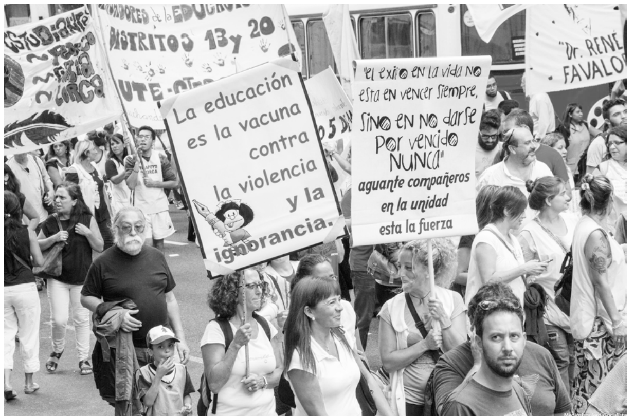
Vista de una de las marchas docentes del mes de marzo

El gobierno está jugado a derrotarnos en Buenos Aires, donde somos casi el 50% de la docencia nacional. Vidal, con el apoyo de Macri y Cambiemos, quiere "ponernos de rodillas". Con cara de angelito dice que "los docente merecen ganar