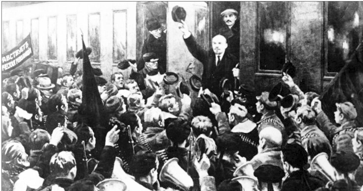
Lenin arribando a la estación de trenes de Petrogrado

Animado por las noticias de la Revolución de Febrero y preocupado por la política titubeante ante