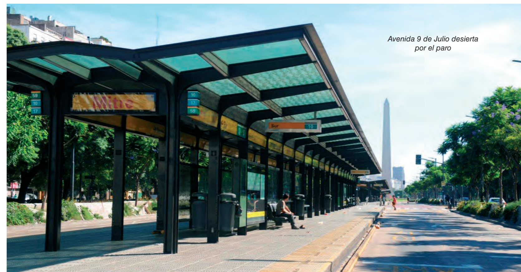
Avenida 9 de Julio desierta por el paro