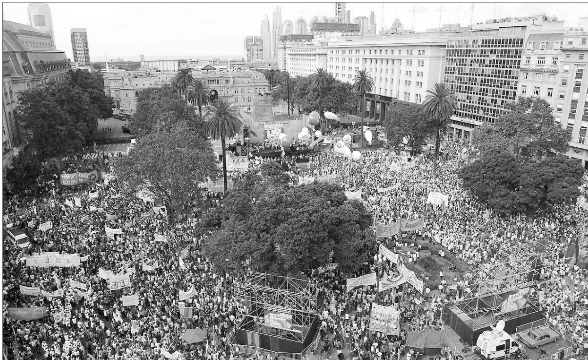
Una de las multitudinarias marchas del mes de marzo

El “vamos a volver” se cantó el 24 de marzo y en la marcha federal educativa. También en las movilizaciones del 6, 7 y 8 de marzo. Se trata, obviamente, de una consigna impulsada por los dirigentes kirchneristas. Queremos debatir fraternalmente con aquellos compañeros que coinciden con ella, con quienes nos encontramos todos los días en la calle, en los paros y movilizaciones, dando la pelea contra el gobierno. Partimos de un gran punto de acuerdo: tenemos que derrotar el ajuste de Macri y para