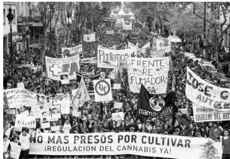
Marcha mundial por la legalización de la marihuana del año pasado. El próximo 6 de mayo volveremos a participar